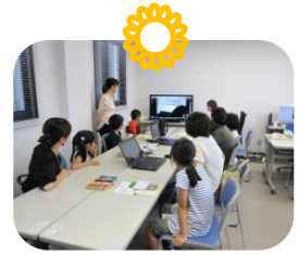
親子ワークショップ